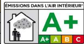
Tableau n°17 : Classement COV